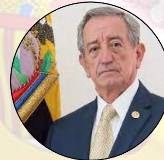
GRAD. (S.P.) DR. OSWALDO JARRÍN R. EX MINISTRO DE DEFENSA NACIONAL DE ECUADOR ACADÉMICO UNIVERSITARIO